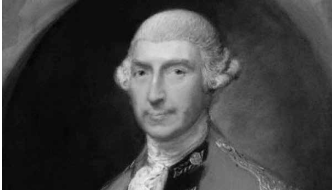
Field Marshal J. Amherst, 1717-1797 | Le maréchal J. Amherst (1717-1797)

commemoration in Canada, but mainly in the areas of southern Ontario he was most associated with. 8 The chief uptick in institutions and places being named after Macdonald seems to have occurred much later, in the 1960s and 70s. These include the Macdonald-Cartier Freeway (c. 1966), the ten dollar note (1971), and the CHA/SHC's Macdonald prize, awarded first in 1977.