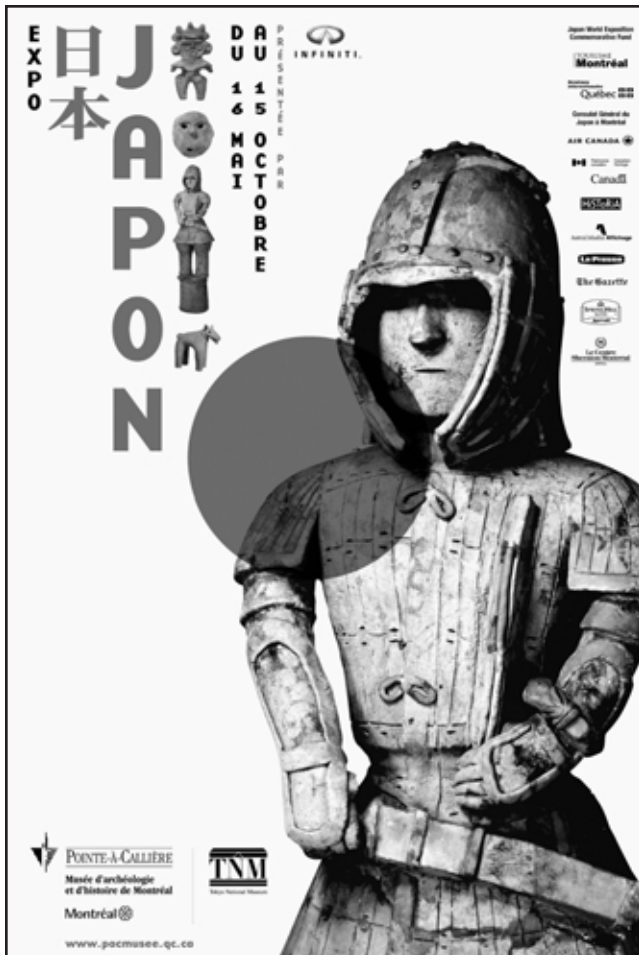
Picture illustrating the Exhibition on Japan at the Museum of Pointe-à-Callières. Illustration faisant la promotion de la nouvelle exposition sur le Japon, au Musée de Pointe-à-Callières.

Un mur de maçonnerie appartenant au fort Ville-Marie et datant du 17 e siècle fut découvert dans le cadre de fouilles menées par l'école de fouilles. L'équipe a découvert des ossements d'animaux, des objets de terre cuite, de la faïence, des grès, etc. dont plusieurs dateraient de l'époque de Maisonneuve. Cette fouille est le fruit d'un partenariat entre le Musée de la Pointe-à-Callières et le Département d'anthropologie de l'Université de Montréal.