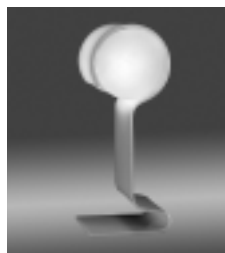
Question-Mark lamp by Danesco. Design: Douglas Ball and John Berezowsky. On loan from Design Exchange, Toronto.

Détails : Exposition qui met en lumière des bâtiments, lieux urbains, des objets, et intérieurs d'édifices. L'exposition du musée se complète par des circuits extérieurs ici et là dans le vieux Montréal. Le Musée de Pointe à Callière organise une série de conférences intitulée « Les samedis de l'Histoire ».