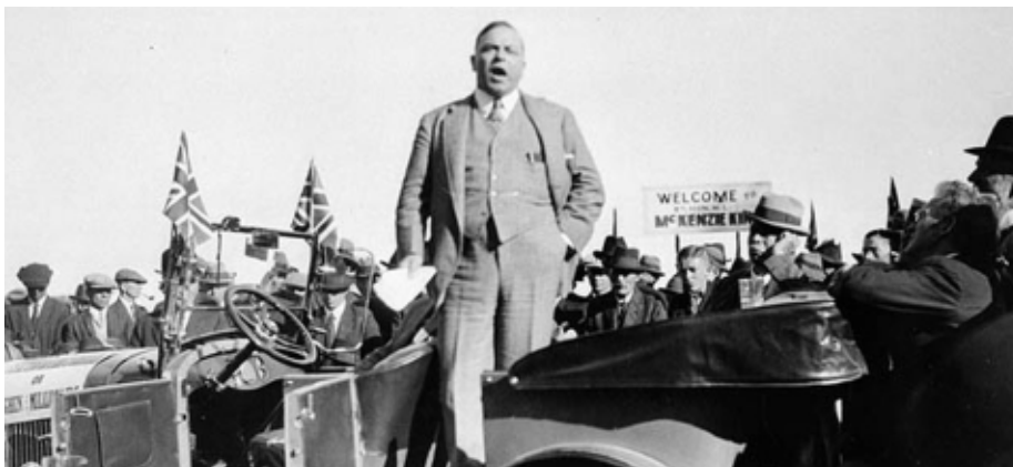
King en campagne électorale, 1926 Archives nationales du Canada Collection William Lyon Mackenzie King, 1964-087 Photographe : Studio Skitch PA-138867

(tiré de http://www.archives.ca/05/0532/053201/05320112_f.html )