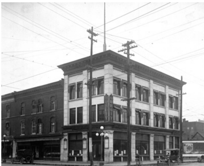
Deuxième édifice du Droit, vers 1923. Le journal y demeura de 1915 à 1929.

http://www.uottawa.ca/academic/CRCCF/passeport/400ans.html